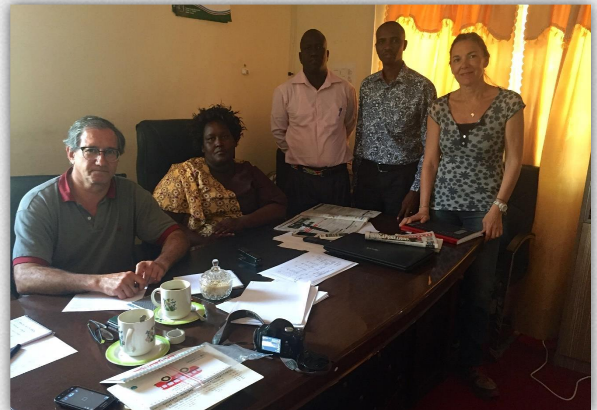
En el Ministerio durante el proceso de selección de candidatos

Como gran novedad de 2016 está la contratación por parte del gobierno de 3 optometristas para Turkana. Nuestros optometristas españoles fueron invitados a participar en el proceso de selección. Una de ellas está destinada en la Eye Unit , para ocuparse de la refracción y dispensación de gafas durante todo el año. ¡Nuestro sueño convertido en realidad!