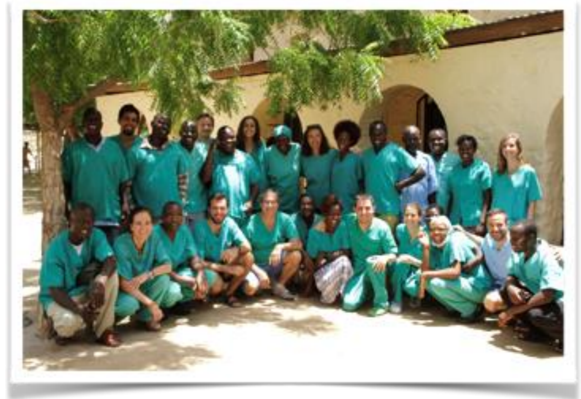
Equipo de la campaña de mayo de 2016

Asimismo, sabemos que no es sostenible trabajar fuera del sistema sanitario local. Por ello buscamos siempre la colaboración con el Ministerio de Sanidad keniano. Además, gracias al proyecto para la erradicación del tracoma, hemos atraído y estrechado lazos para trabajar conjuntamente con dos grandes ONG oftalmológicas con presencia en la zona.: Fred Hollows Foundation (FHF) y Sight Savers International (SSI).