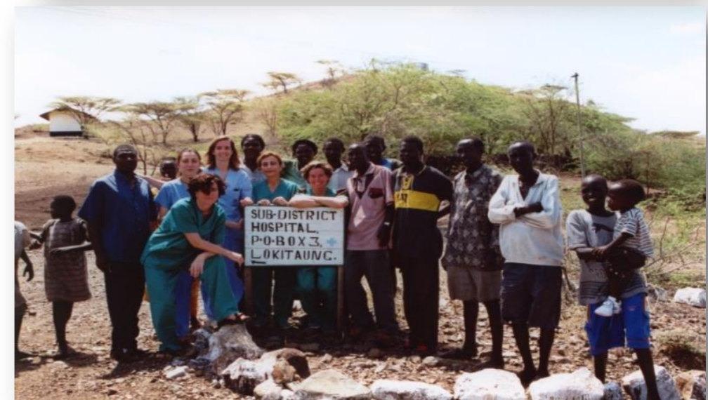
Primeras campañas en Lokitaung